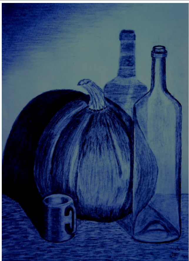
Nature morte. Ombres et transparence

L'application des règles du dessin n'est pas une complication mais au contraire une facilité.